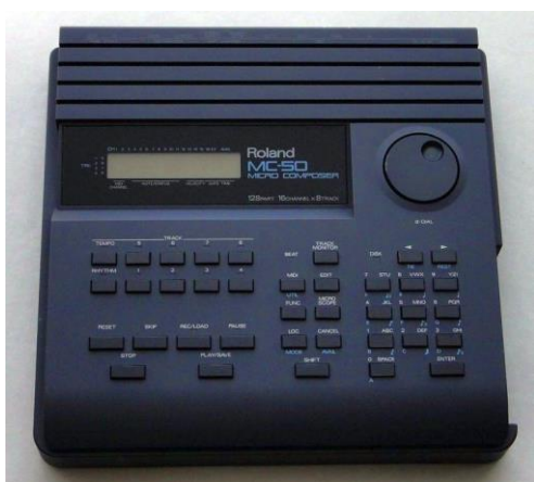
MC-50 ROM Version 0016 90/03/19 09:16

In 1992 verscheen de MC-50 mkII waar het upgraded midi IC al standaard was ingebouwd.