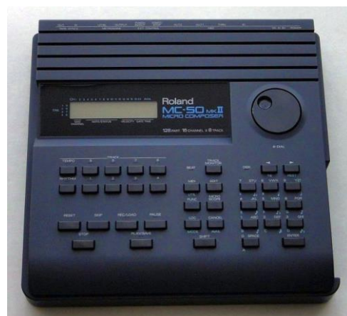
MC-50 mkII ROM Version 0060 93/06/10 16:55