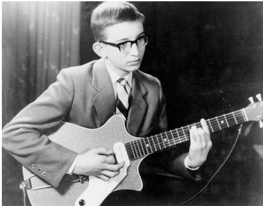
Egmond- Manhattan - m'n eerste gitaar in 1961

Gitaarspelen was begin jaren '60 een ware beproeving voor de beginner. Goede instrumenten waren er nauwelijks en in ieder geval onbetaalbaar. Veel bands speelden op Egmond gitaren zo ook ondergetekende met z'n Manhattan . De Egmonds hadden helaas alles in zich om géén succes te worden: geen halspen en dus een kromme hals, tevens een te brede en te dikke hals, een rechte toets met scherpe, zelfs wat hol liggende messing fretten die snel sletten, hoge snarenligging, slap geluid, slechte mechanieken, wrak hout, duffe kleuren en ga zo maar door.