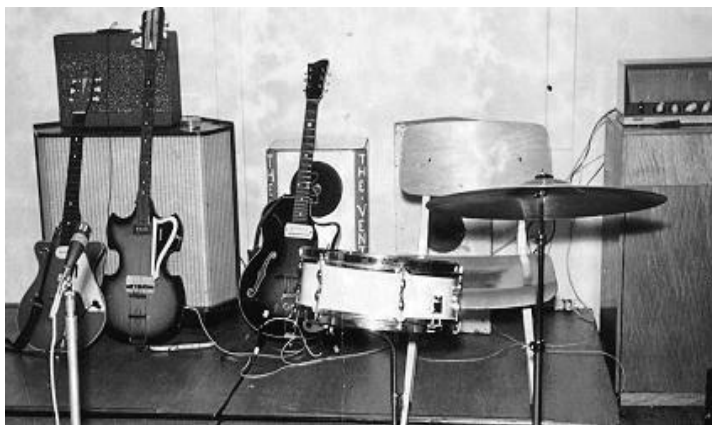
Jennen (Teisco) versterker, eronder een speakerkast van de school, zelfgemaakte speakerkast, achter de stoel nog een zelfgemaakte kast, Geloso-versterker met witte draaiknoppen en (uiterst rechts, niet zichtbaar) een pick-upversterker als zangversterker! Egmond-Manhattan, zelfgemaakte vioolbas, Famos archtop. Eén bekken, een snare-drum en één microfoon. Maart 1963