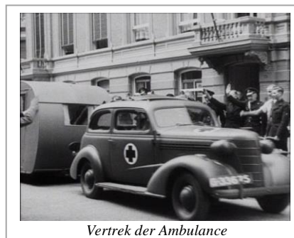
Vertrek der Ambulance

De Nederlandsche Ambulance is niet zozeer een ambulancedienst met wagens, maar een mobiel veldhospitaal, een lazaret . In dit geval een door artsen-collaborateurs bemande eenheid, een ‘ Sanität Einheit ’ die ter beschikking van de Duitse troepen staat. Uiteraard met NSB verpleegkundigen.