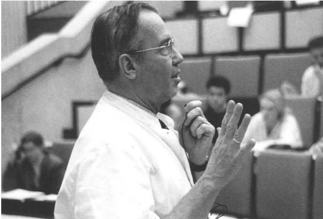
Fig. 3. Het laatste college voor studenten (17 december 1996).

Huizing: docent ( Fig. 3 ), organisator, opleider, stimulator, gangmaker, denker, redenaar. En ook, geestig, spits, integer, energiek, soms oninvoerbaar, afstandelijk, precies, slim, beheerst, diplomatiek, rustig, welbespraakt, vriendelijk.