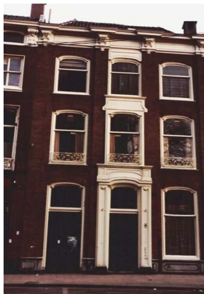
Riviermarkt № 4 's-Gravenhage