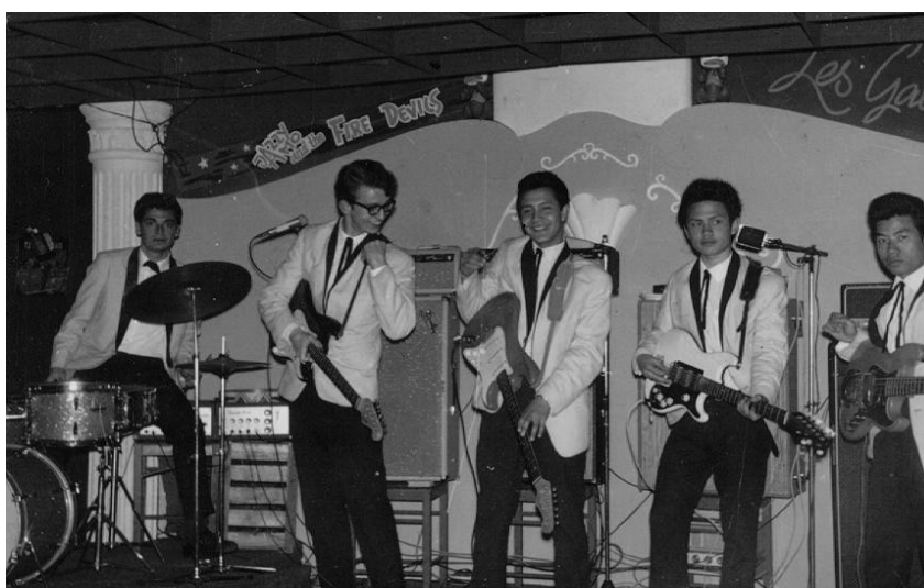
The Raylettes 1965

(geluidsfragment: Crazy Rockers met Jazzmaster sound.