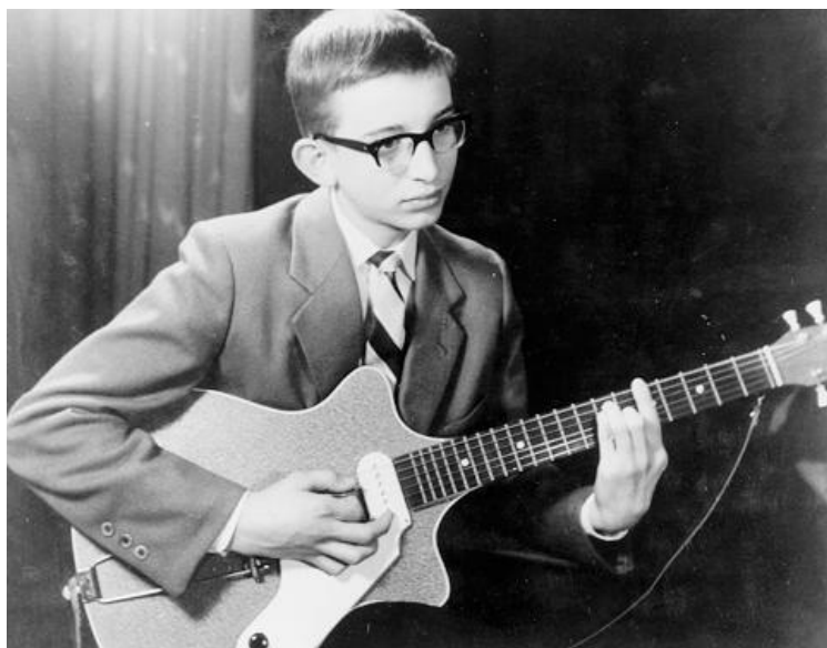
De auteur (15) in 1961 met z'n eerste elektrische gitaar