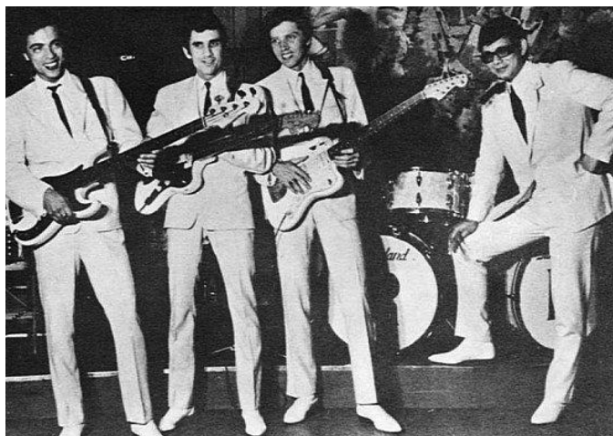
the Timebreakers ± 1968